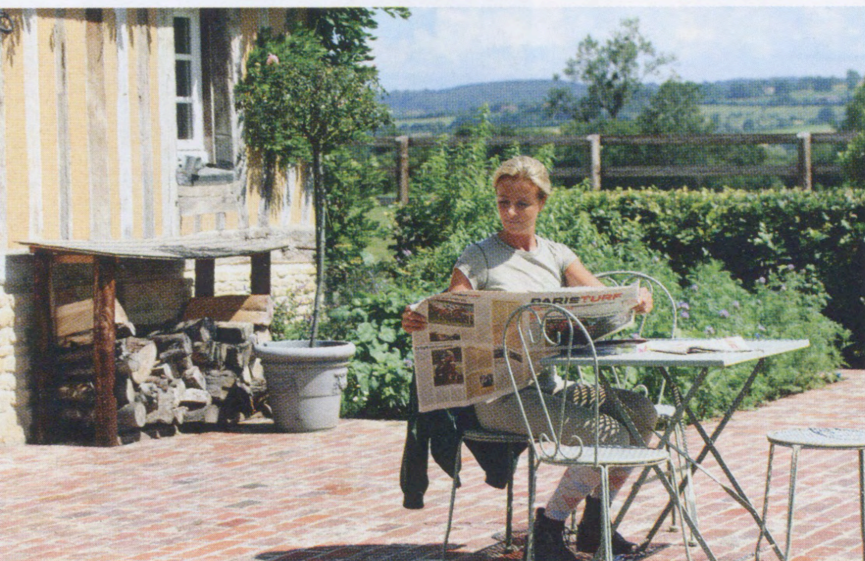
Unni möttes av fördomar; komma här som kvinna och skandinav! Men hon har skinn på näsan och stortrivs.

– Mitt jobb består till stor del av planering och organisering inför auk-