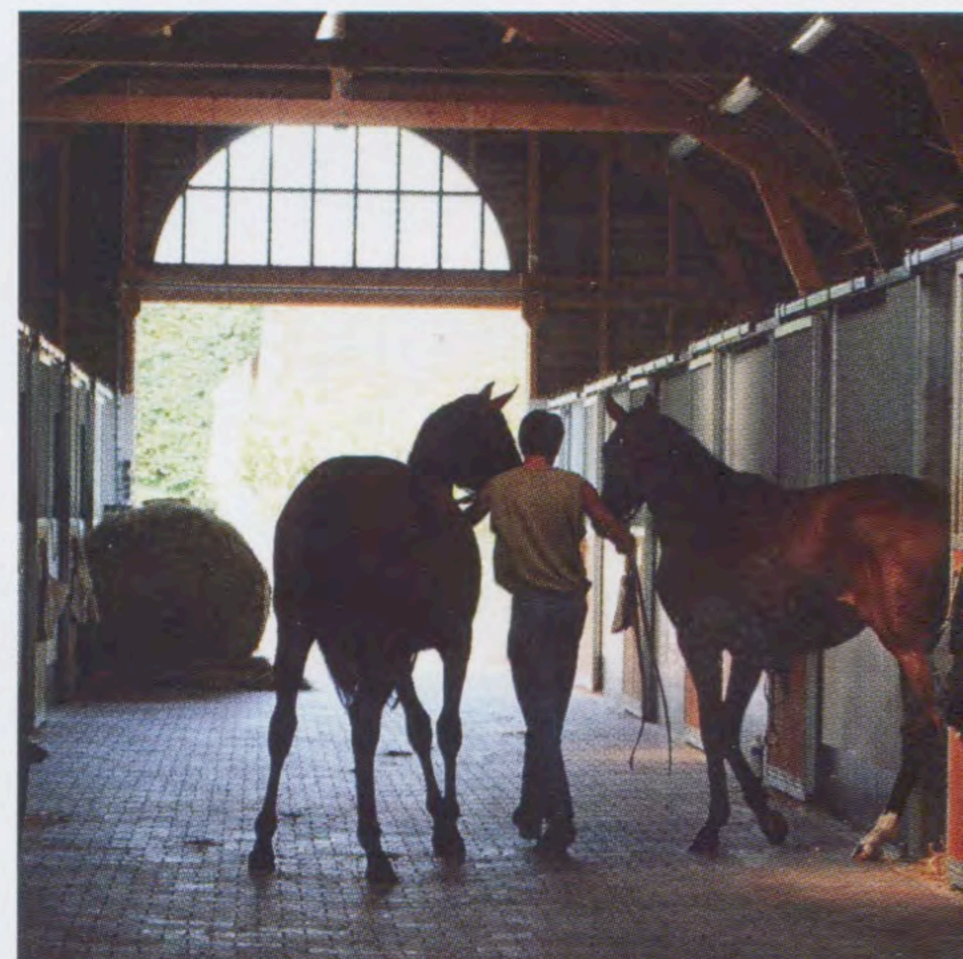
Stallet är av amerikansk modell och otroligt välskött.

Det är mitt i sommaren när Ridsport besöker Haras de la Poterie i Normandie i Frankrike. Vi är nära staden Deauville och stuterierna imponerar med näpna föl, galopperande unghästar och anrika byggnader. Området räknas som det bästa för fransk hästavel när det handlar om engelska fullblod och selle français.