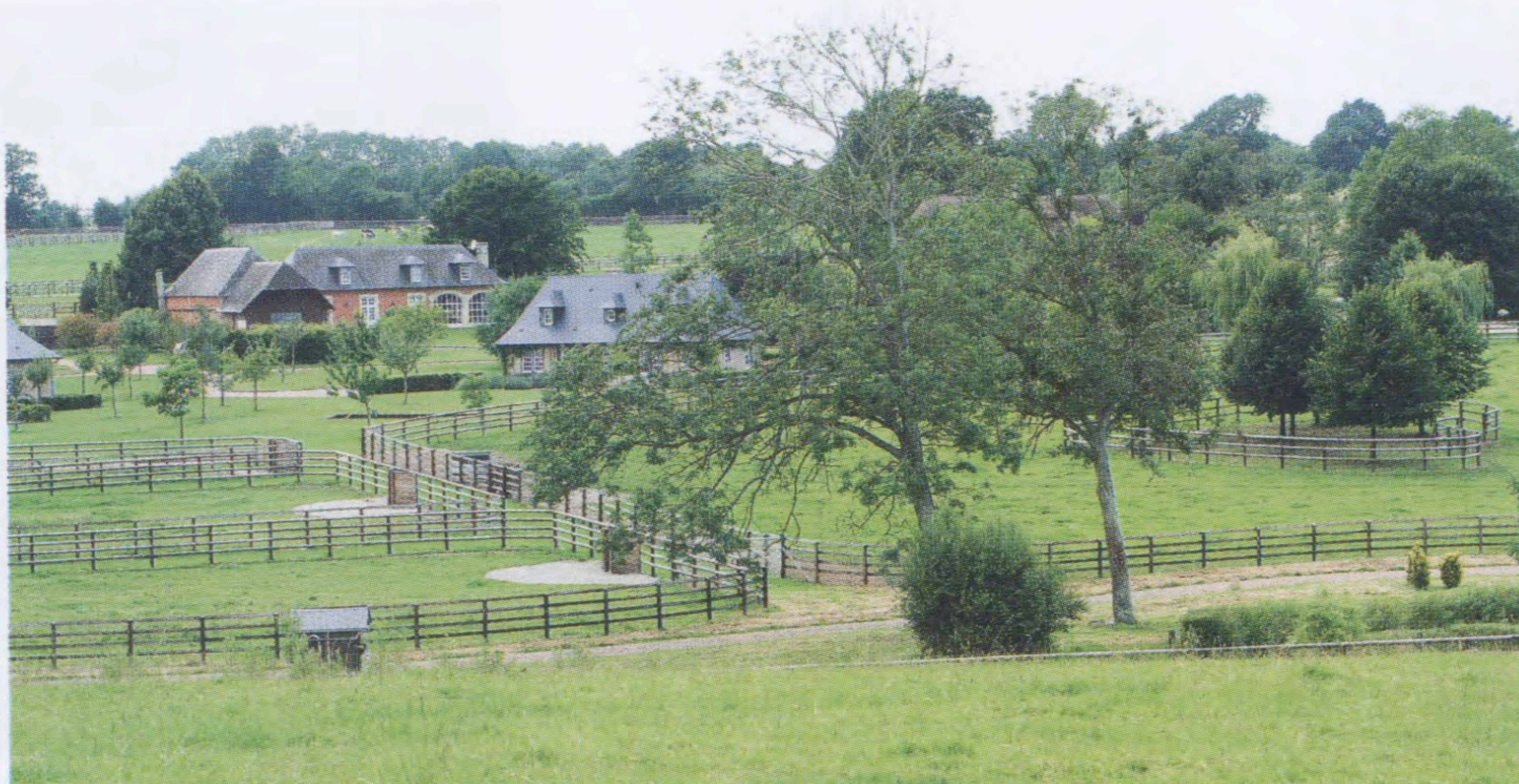
Normandie är känt för hästuppfödning. Haras de la Poterie är ett av många stuterier.

– Då tar jag en lång galopp längs stranden och låter tankarna flyga. □