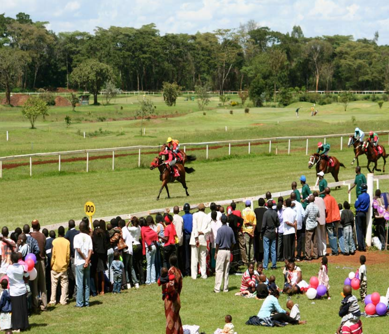
Åskådare av olika hudfärger, nationaliteter och samhällsklasser strömmar till och det är feststämning i luften. På innerplan spelas det golf.

D et luktar nyklippt gräs, häst och...pop corn. Solen lyser från en klarblå himmel och temperaturen ligger som större delen av året runt behagliga 20 grader.