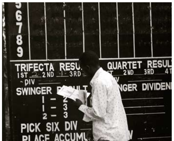
Att gå på galopp i Nairobi är lite som att kliva in i en tidsmaskin. Då syftar jag inte enbart på sådant som att resultaten sätts upp för hand

Känslan av en svunnen tid är högst närvarande men de blanka välmusklade fullbloden skulle kunna smälta in på vilken nu-